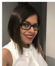
Ms. Vivas-Lara Teacher on Special Assignment (TOSA)