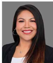
Ms. Cuevas Community Schools Coordinator