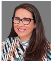
Ms. Mier Head of School